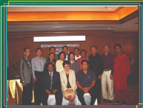
ประธาน ส.พ.ท. ร่วมสัมมนา เรื่อง 'ค่าจ้างที่สามารถครองชีพได้อย่างมีประสิทธิภาพ ในระดับนานาชาติ' ( 28 - 30 ก.ย. 54 )