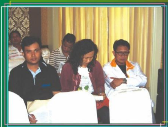
กรรมการสัมมนา เรื่อง 'นโยบายค่าจ้างวันละ 300 บาท รัฐบาลยิ่งลักษณ์ ความฝันหรือความจริง' ( 25 ก.ย. 54 )