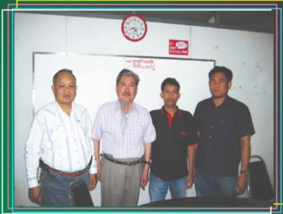
ประธานสหพันธ์แรงงานอุตสาหกรรมสิ่งทอฯ เข้าพบอาจารย์จากประเทศญี่ปุ่น ( 9 ก.ย. 54 )